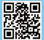
자세한 사항은 '써니뱅크' 모바일 앱에서 확인해주세요