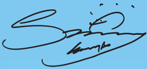
써니뱅크 전속모델 소녀시대 써니